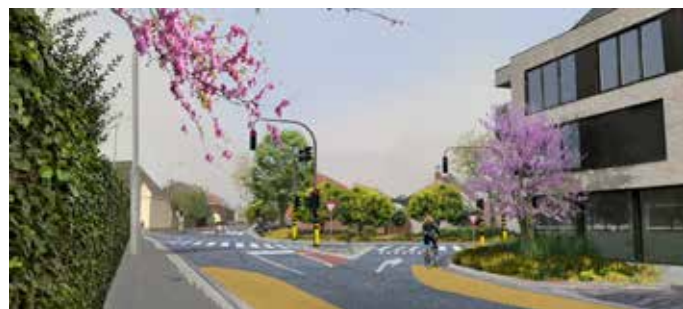
▲ Na de herinrichting