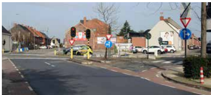
▲ Huidige situatie