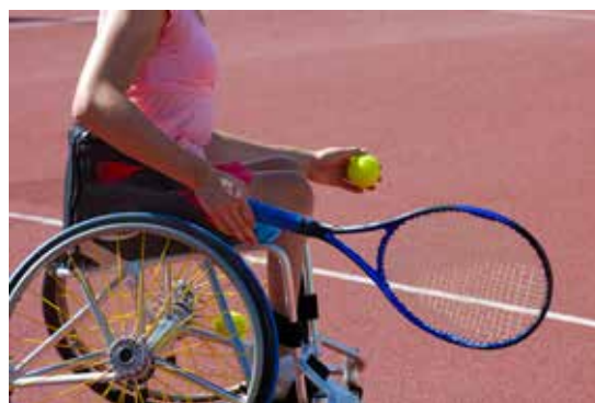
▲ Verenigingen kunnen tot 10.000 euro krijgen om hun aanbod uit te breiden naar mensen met een beperking.

Zo hopen we dat personen met een beperking makkelijker aansluiting vinden bij ons verenigingsleven en kunnen genieten van een kwalitatieve vrijetijdsbesteding.