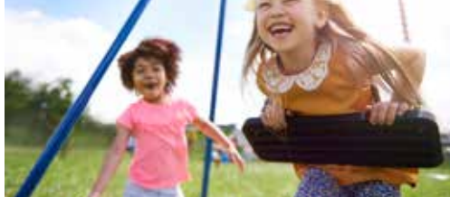
Speelpleinwerking verdrievoudigt p. 2