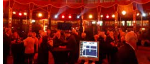
Veel volk op Feestweekend Eperon d'Or p. 3